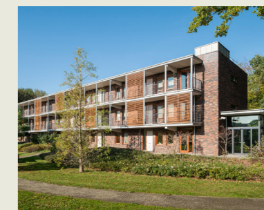
Appartementen Meezenbroek, 2009

De 100-jarige Voorzorg wordt Vincio Wonen: een jonge, energieke organisatie die een thuis biedt aan ruim 2.900 huishoudens in Heerlen, Hoensbroek en Brunssum.