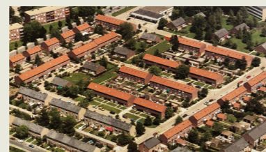
Wijk De Dem, jaren 60

Na de oorlog kostte het de Voorzorg veel moeite om bouwplannen van de grond te krijgen. Bijna wordt de moed opgegeven, maar begin jaren 50 keert het tij met de bouw van 144 flatwoningen in het Schaesbergerveld. Daarna volgen projecten in Beersdal, Litscherveld en Hoensbroek.