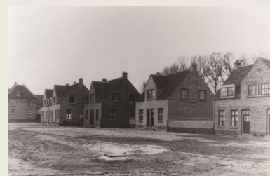
Woningen WS De Voorzorg in de woonwijk Passart

In het bijzonder richtte De Voorzorg zich op de vele protestants-christelijke nieuwkomers die vanuit de noordelijke provincies en het westen naar Limburg kwamen om hier een bestaan op te bouwen.