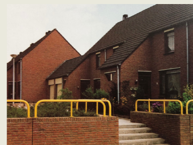
Woningen Rennemig, jaren 80

Het kantoor verhuist in 1982 naar de Wilhelminastraat in Hoensbroek. Maar dat pand is ook snel weer te klein. In 1986 volgt de verhuizing naar de Heisterberg 70, het huidige kantoor. In die tijd worden veel nieuwe woningen gebouwd in o.a. Nieuw-Rennemig en De Dem.