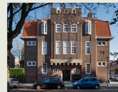
Oude Bibliotheek, Tempsplein

Er zijn mooie zorgcomplexen en levensloopbestendige woningen toegevoegd aan het woningaanbod. Denk aan Emmastaete, de seniorenwoningen aan de Ir. Bongardstraat in Brunssum en de Schutse in Hoensbroek. Ook zijn monumenten behouden, zoals het voormalige ziekenhuis aan De Putgraaf in Heerlen. De oude bibliotheek aan het Tempsplein en de oude Hoeve Passart en Hoeve Lotbroek.