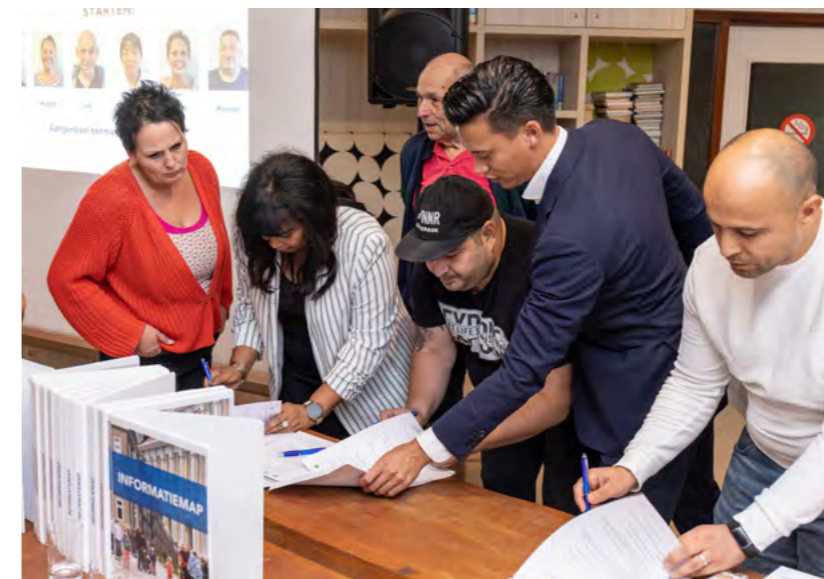
De bewonerskrachten ondertekenen hun certificaat.